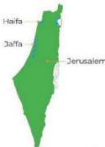
Map of 1917

Before the British Mandate in Palestine, Jews made up around six percent of the total population.