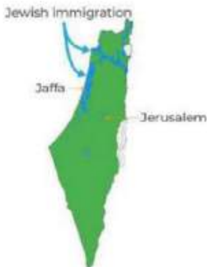
Map of 1918 – 1947

Under the British Mandate, the Jewish population in Palestine increased from 6 percent (1918) to 33 percent (1947).